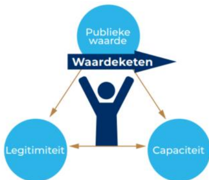
Figuur 1. Schematische weergave van de waardendriehoek en waardeketen.

In een waardeketen werken betrokkenen samen aan het realiseren van de publieke waarde. Deze keten bestaat uit opeenvolgende activiteiten die leiden tot output die bijdraagt aan het bereiken van de publieke waarde en kan rekenen op draagvlak. Volgens Moore is het daarbij essentieel dat er een goede balans is tussen drie elementen: de inzet van capaciteit, de legitimiteit vanuit de omgeving en de publieke waarde zelf. Wanneer de elementen in balans zijn is een overheidsorganisatie in staat om effectief maatschappelijke meerwaarde te creëren.