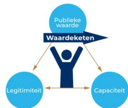
Figuur 1. Schematische weergave van de waardendriehoek en waardeketen.

De uitwerking van de waardendriehoek, waardeketen en het evaluatiekader zijn te vinden in bijlage 1.